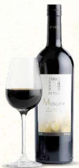
VINO DULCES NATURALES