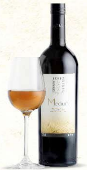
VINO GENEROSO DE LICOR