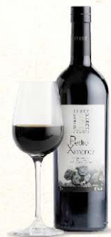
VINO DULCES NATURALES