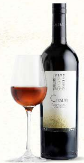
VINO GENEROSO DE LICOR