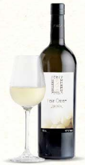
VINO GENEROSO DE LICOR